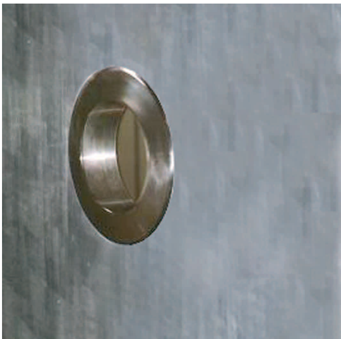
Figura 3: Vista del Adaptador dentro del tanque

El Transmisor de Densidad, modelo sanitario, es adecuado para instalaciones de cervecería, utilizando conexión del tipo tri-clamp para acoplar el equipo al proceso.