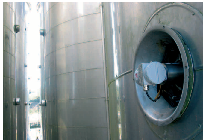
Figura 4: DT302S instalado en el Tanque de Fermentación

Si es necesario, se puede recalibrar el instrumento en línea sin quitarlo del tanque y sin interrumpir el proceso.