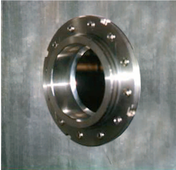
Figura 2: Vista del Adaptador fuera del tanque

A continuación, se muestran fotos ilustrativas del adaptador del tanque para la instalación del Transmisor de Densidad.