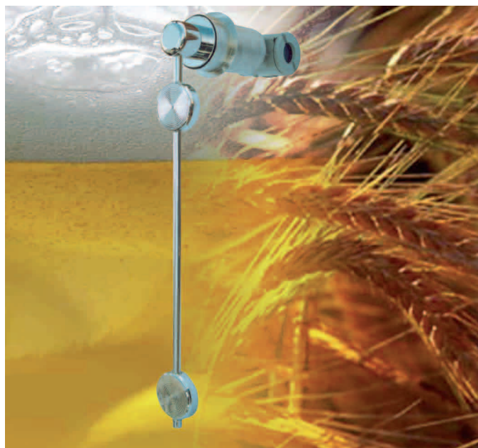
Figura 1: Transmisor de Densidad – Modelo Sanitario DT302S

El DT302 utiliza el principio de medición de presión diferencial hidrostática ( d = \Delta p / g \cdot h ) para calcular la densidad del fluido del proceso. Es un producto patentado que cuenta con una sonda, inmersa en el fluido del proceso, donde se ubican dos sensores de presión y un sensor de temperatura, utilizados para compensar automáticamente cualquier variación del proceso.